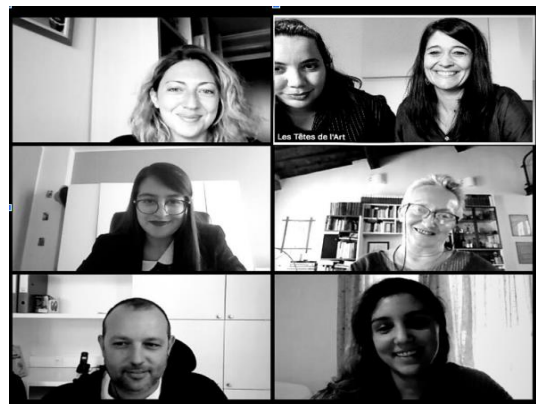
Photo: Meeting, Oct 2021

Le MOOC ENACTING et le Participatory Media Lab visent à créer des outils permettant l'empowerment des citoyens. Ils s'adressent à toute personne engagée ou désireuse de s'impliquer dans les enjeux sociétaux ! Le projet cible les communautés locales, les migrants, les personnes handicapées, les jeunes, les organisations locales et communautaires, les maisons de la jeunesse et les ONG.